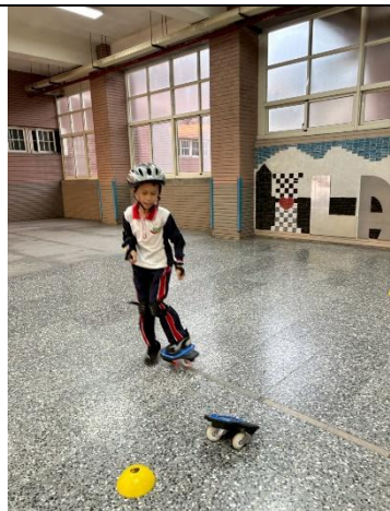
說明：雙龍板單板上板