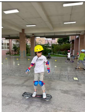
說明：蛇板踩前滑行