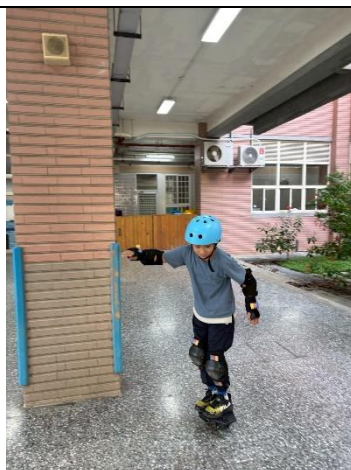
說明：雙龍板前單板直線