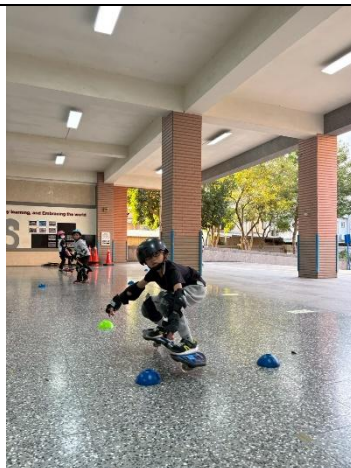
說明：蛇板蹲溜滑行