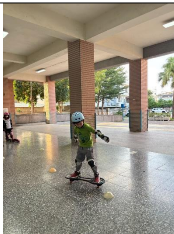
說明：蛇板 S 形過角標